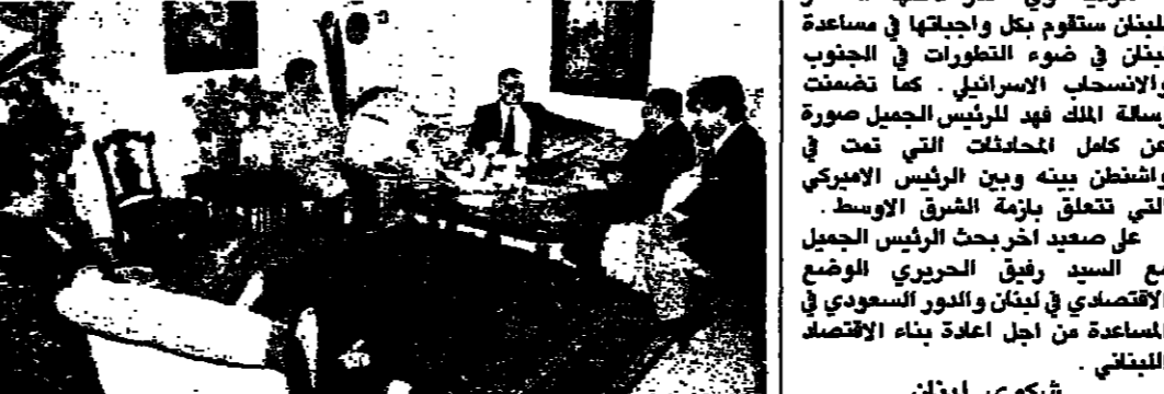
الرئيس يخلص مع السيد مسن ملو... (في اليمين) وزير الخارجية السيد رشيد كراي مع الرئيس كراي في القصر الحكومي امس الاول في السراي الفخخة امس الاول في

قال الرئيس كراي في تصريح له امس ان مجلس الوزراء يدعو لخطبة تقرير لجنة المراسم التشريعية الى ان يرأسها وزيرها ولا بد ان تكون شكوى لبنان لمجلس الامن ضد اسرائيل في جلسة المواضيع التي سينتقلها البحث.